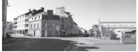
Croisement de la rue Jules Ferry et du bd Carnot...

Le Comité, en rendant public son projet au sud de la gare, a permis de faire avancer