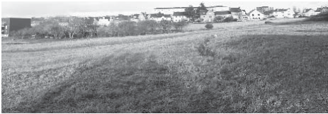
Tertre Marie Dondaine

Ce sera le sujet d'une de nos prochaines rencontres ainsi que les réponses écrites apportées par la Ville aux remarques du CAR.